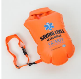
↑エマージェンシーフロート

*大会当日、過去の T シャツやキャップ、SAFESEA（クラゲ除け日焼け止め）などの販売行いますのでご購入希望の方はご予算お持ちの上、早めに販売ブースにお寄りください。また、腰ベルトを装着して浮き具をつけながら泳ぐエマージェンシーフロートも特別価格の4500円で販売します。各地で入荷待ちでなかなか手に入らないのですが世界各地で海で泳ぐ際の目印、休憩にと練習などで使用されているスイマーが多くいます。1人で練習するときなどは水難事故防止のため必ず遠くからも泳いでることがわかるようなエマージェンシーフロートのようなものを装着して泳ぐことをお勧めします。